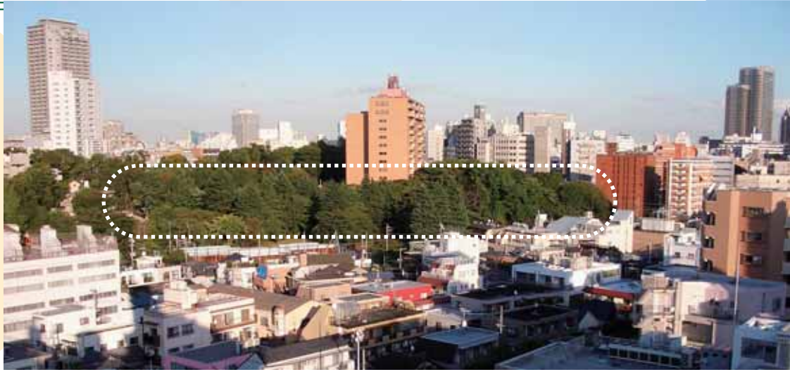
点線内の緑がJR跡地

上目黒1丁目の旧国鉄清算事業団宿舎跡地（JR跡地、約8500㎡）の利用をめぐり、現在、大企業の利益を優先し、開発型ですすめてしまうのか、それとも公的住宅と緑地の整備など区民利用中心にすすめるのかが問われる事態となっています。